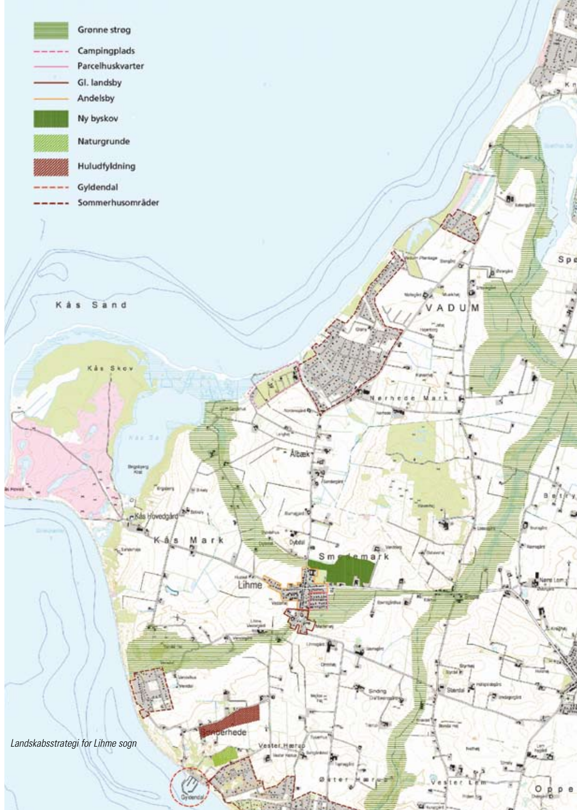
Landskabsstrategi for Lihme sogn