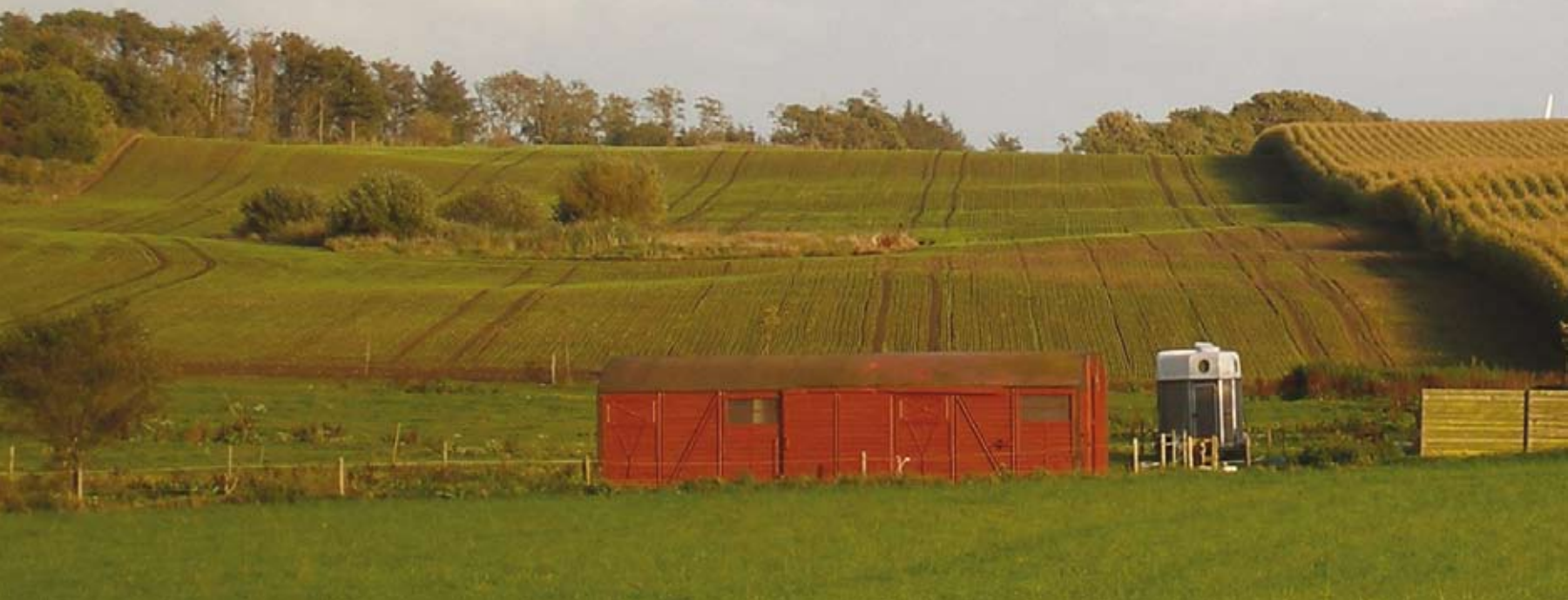
Kombineret produktions- og fritidslandskab ved Lihme.

Som grundlag for studiekredsens arbejde blev der dels udarbejdet en 'analysemappe', og dels en landskabsanalyse, der bestod i en inddeling af sognet i homogene 'områdetyper', med tilhørende kort karakteristisk af de dominerede karaktertræk. Studiekredsen blev i øvrigt anmodet om at tage stilling til, om inddelingen svarede til deltagerens egen oplevelse af det lokale landskab og eventuelt foreslå alternative afgrænsninger. Områdeinddelingen viste sig at have stor værdi for studiekredsens arbejde, ligesom Skive Kommune fandt inddelingen så værdifuld for kommuneplanarbejdet, at man – uden for projektets rammer – efterfølgende fik lavet en tilsvarende analyse for hele kommunen.