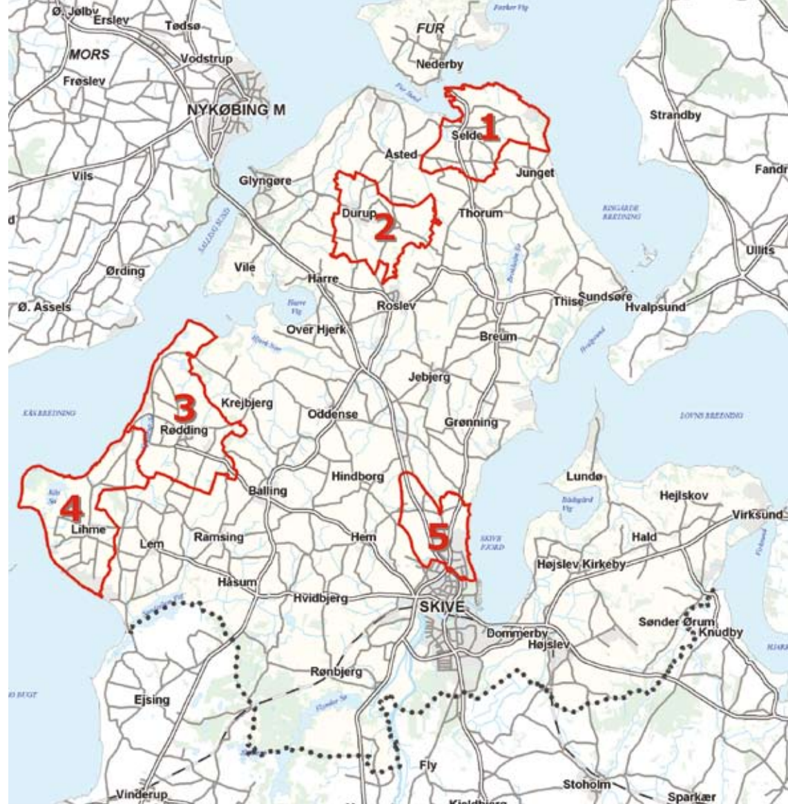
Illustration: Skive Kommune

Ved projektets start i foråret 2008 blev der efter et informationsmøde for indbudte og interesserede fra de fem områder nedsat en studiekreds for hvert område. Studiekredsene blev i første omgang nedsat af kommunen ud fra lokalt kendskab til engagerede borgere og ønsket om bredde i gruppen m.h.t. bopæl, erhverv, køn og alder. Men grupperne havde mulighed for at supplere sig med andre lokale, hvis der var behov og interesse for det. Hver gruppe fik en kontaktperson fra kom-