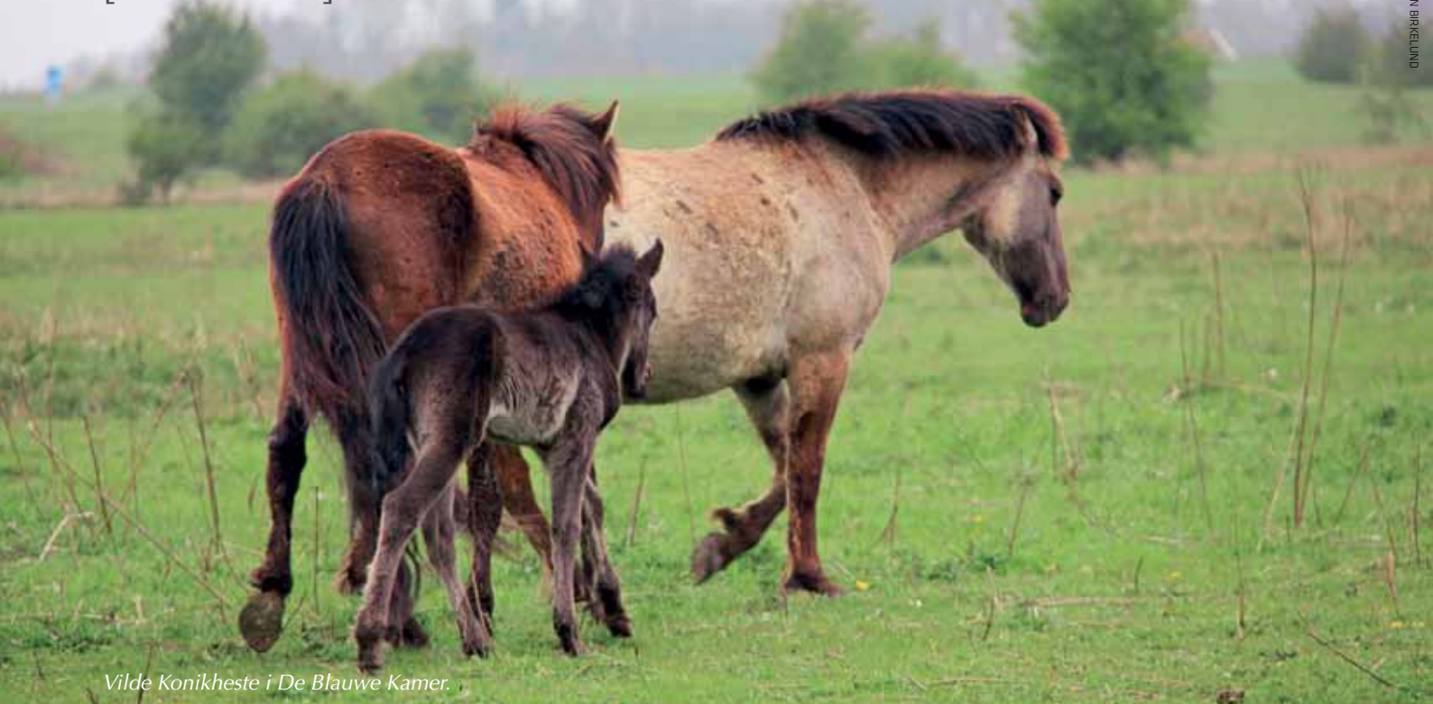
Vilde Konikheste i De Blauwe Kamer.